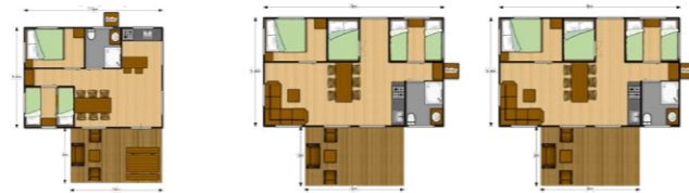
Safaritent 5 personen Safaritent 7 personen Safaritent 8 personen